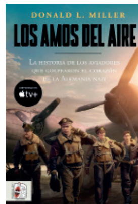
LOS AMOS DEL AIRE DONALD L. MILLER / DESPERTA FERRO.

Obra monumental del historiador estadounidense Donald L. Miller, un viaje trepidante, profusamente documentado y con un pulso narrativo digno del mejor guionista de Hollywood a través de los cielos teñidos de fuego sobre Berlín, Hannover y Dresde, una guerra sin cuartel con devastadores consecuencias para la Alemania nazi y también su población civil. La campaña de bombardeos angloamericana contra el Tercer Reich fue la operación militar más larga de la Segunda Guerra Mundial, una guerra dentro de otra guerra. Hasta que los soldados aliados entraron en Alemania en los últimos meses antes de su caída, fue la única batalla librada en territorio germano.