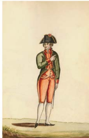
Real Cuerpo de Ingenieros Cosmógrafos de Estado