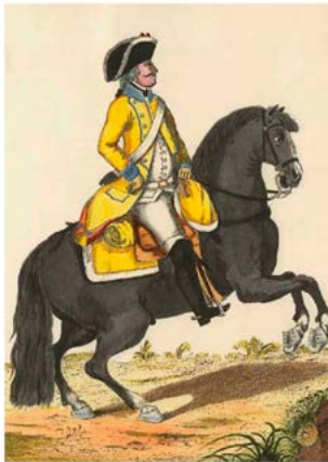
Regimiento de Dragones de la Reina