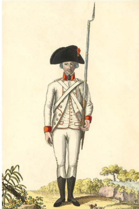
Regimiento de Infantería de la Reina