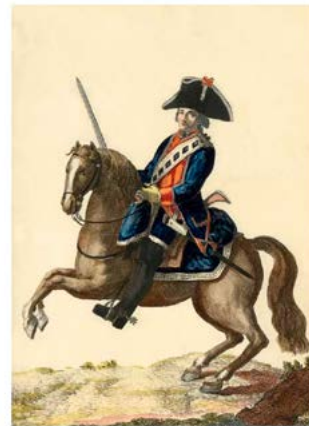
Guardia de Corps, Compañía Americana