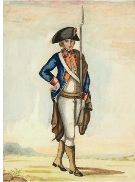
Regimiento Primero de Voluntarios de Infantería Ligera de Aragón